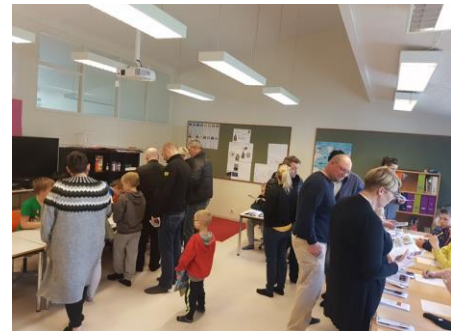
Foreldrar á ferðakynningu hjá miðstigi

Leið: Með öflugri upplýsingamiðlun til foreldra. T.d. með virkri heimasíðu og upplýsingafundum. Haldnir verði að minnst kosti þrjár samstarfsfundir foreldra og skóla á skólaárinu. Haustfundur þar sem helstu verkfæri Uppbyggingar verða kynnt fyrir foreldrum og hlutverk foreldra og skóla vegna skólagöngu verða skilgreind, fræðslufundur um læsi og hlutverk heimila við lestrarþjálfun í nóvember og á vorönn verði vinnufundur með foreldrum þar sem einkunnarorð skólans verða skilgreind. Sett verði að minnsta kosti ein frétt á heimasíðu skólans vikulega. Allir foreldrar fái aðgang að “Mentor” þar sem ýmsar upplýsingar varðandi námsframvindu nemenda eru geymdar. Allir námshópar bjóði foreldrum einu sinni á skólaárinu á kynningu eða annan viðburð sem nemendur og kennarar skipuleggja saman.