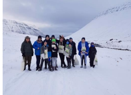
Útivist var stunduð allt árið

Í þessu vali var blandaður hópur úr 7 – 10 bekk. Lögð var áhersla á fjölbreytta útivist í formi hreyfingar, göngutúra, hlaupa, hjólreiða og æfinga. Einnig var nemendum kennt hvernig þeir gætu eytt tíma utandyra án þess að vera að gera eitthvað sérstakt.