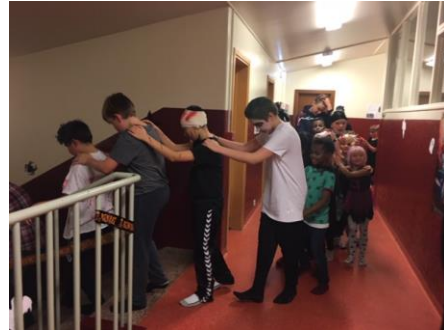
Nemendur á Halloween balli

Í skólanum starfaði einnig nemendaráð sem skipuleggur félagslíf nemenda. Í því sitja allir nemendur unglíngastigs. Vinna þess var með hefðbundnum hætti, skipulögð voru margskonar skemmtikvöld, leikir og fleiri uppákomur fyrir alla í skólanum. Ekki náðist að koma út skólablaði að þessu sinni.