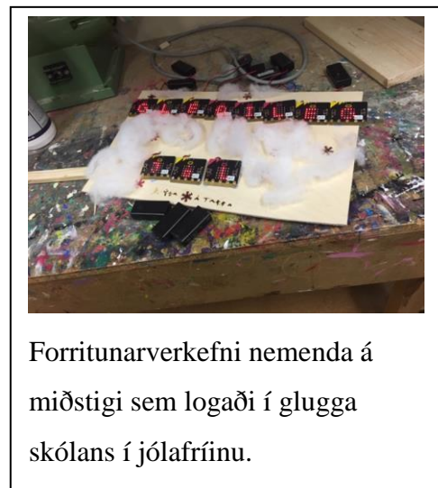
Forritunarverkefni nemenda á miðstigi sem lögð í glugga skólans í jólafríinu.

Nemendur skólans eru tæplega 40 og er kennt í þremur bekkjardeildum. 1.-4.bekkur með 15 nemendur, 5.-7.bekkur með 12 nemendur og 8.-10.bekkur með 11 nemendur. Við skipulag skólastarfsins er lögð áhersla á að uppfylla skyldur samkvæmt viðmiðunarstundaskrá þrátt fyrir að það geti verið flókið þegar um svo fáa nemendur er að ræða. 1.-6.bekkur eru saman í verkgreinum sem eru skipulagðar sem smiðjur, þá fara nemendur í tilteknar vikur í hverja grein og skipta svo. Aukin áhersla var lögð á forritunarkennslu sem nemendur voru mjög áhugasamir um. 7.-10.bekkur voru saman í samskonar fyrirkomulagi í valgreinum. Allar valgreinar voru kenndar af kennurum skólans og réðist framboðið af þeim viðfangsefnum sem þeir treystu sér til að kenna. Sund var kennt í námskeiðsformi á haustönn og til stóð að vera einnig með námskeið á vorönn en ekki fékkst kennari í það. Nemendur á mið-og eldra stigi fengu 30 sundtíma í vetur en nemendur yngra stigs aðeins 15 tíma. Dans