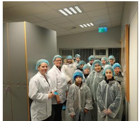
Miðstig í heimsókn hjá Íslandssögu

kennsluáætlunum og skipulagi kennslu. Kennarar frá okkur fóru einnig á samstarfsfundi með kennurum sem kenna sömu viðfangsefni í öðrum skólum. Þá var haldinn einn samstarfsfundur með kennurum unglingastigs og kennurum Menntaskólans á Ísafirði. Nemendur okkar fóru einnig í nokkuð margar heimsóknir svo sem heimsókn í Íslandssögu í tengslum við fiskapema á miðstigi og í Engidalsvirkjun í tengslum við orkupema.