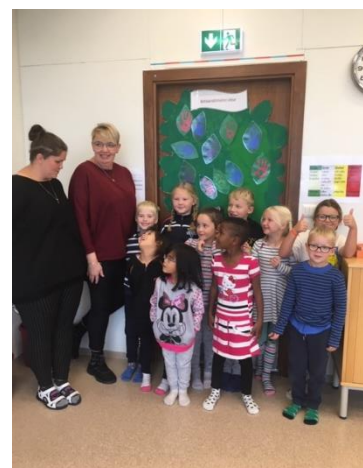
Nemendur og starfsmenn yngsta stigs við bekkjarsáttmálann sinn